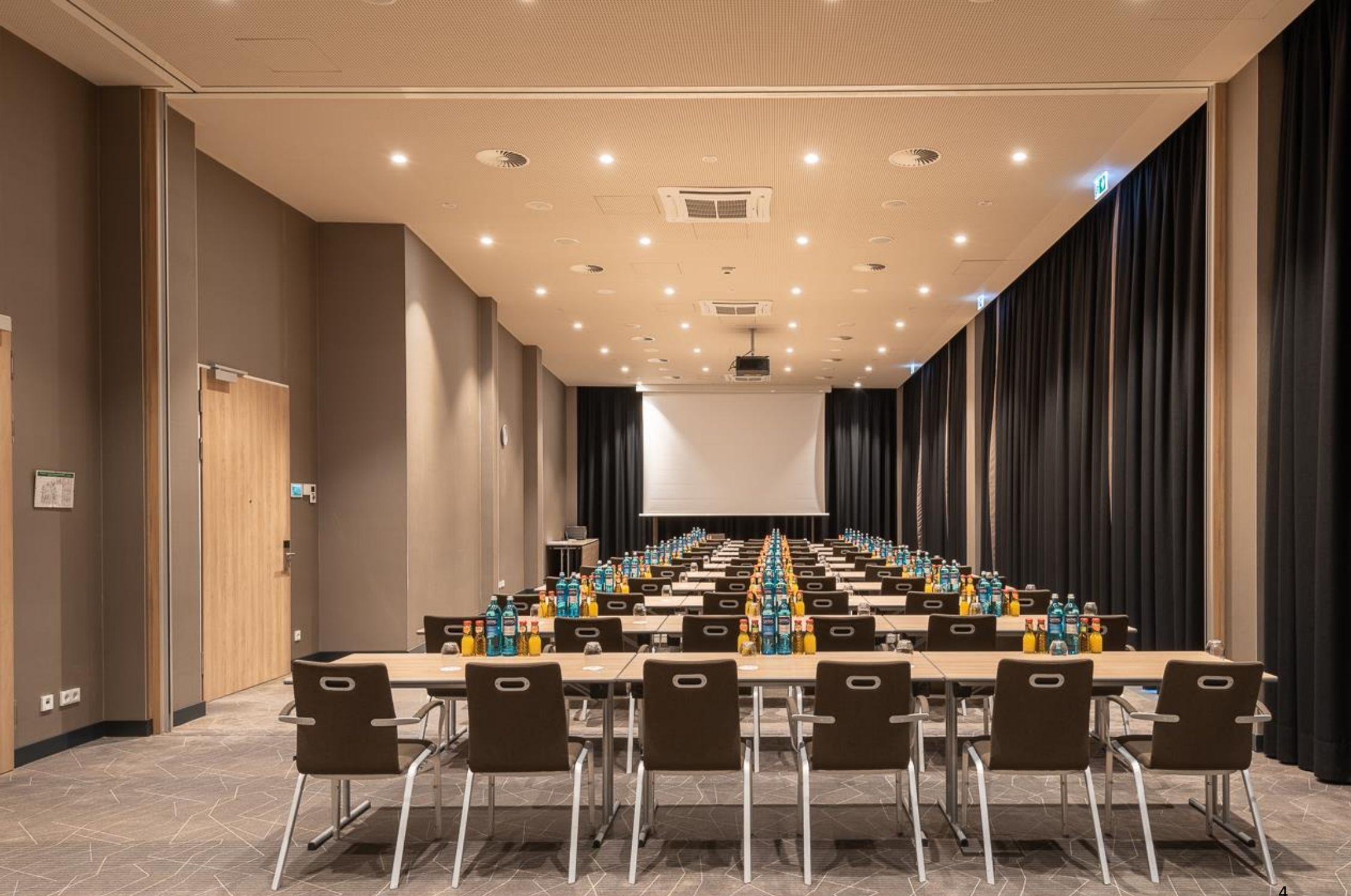
Flexible Meetingräume mit natürlichem Tageslicht und Verdunklung