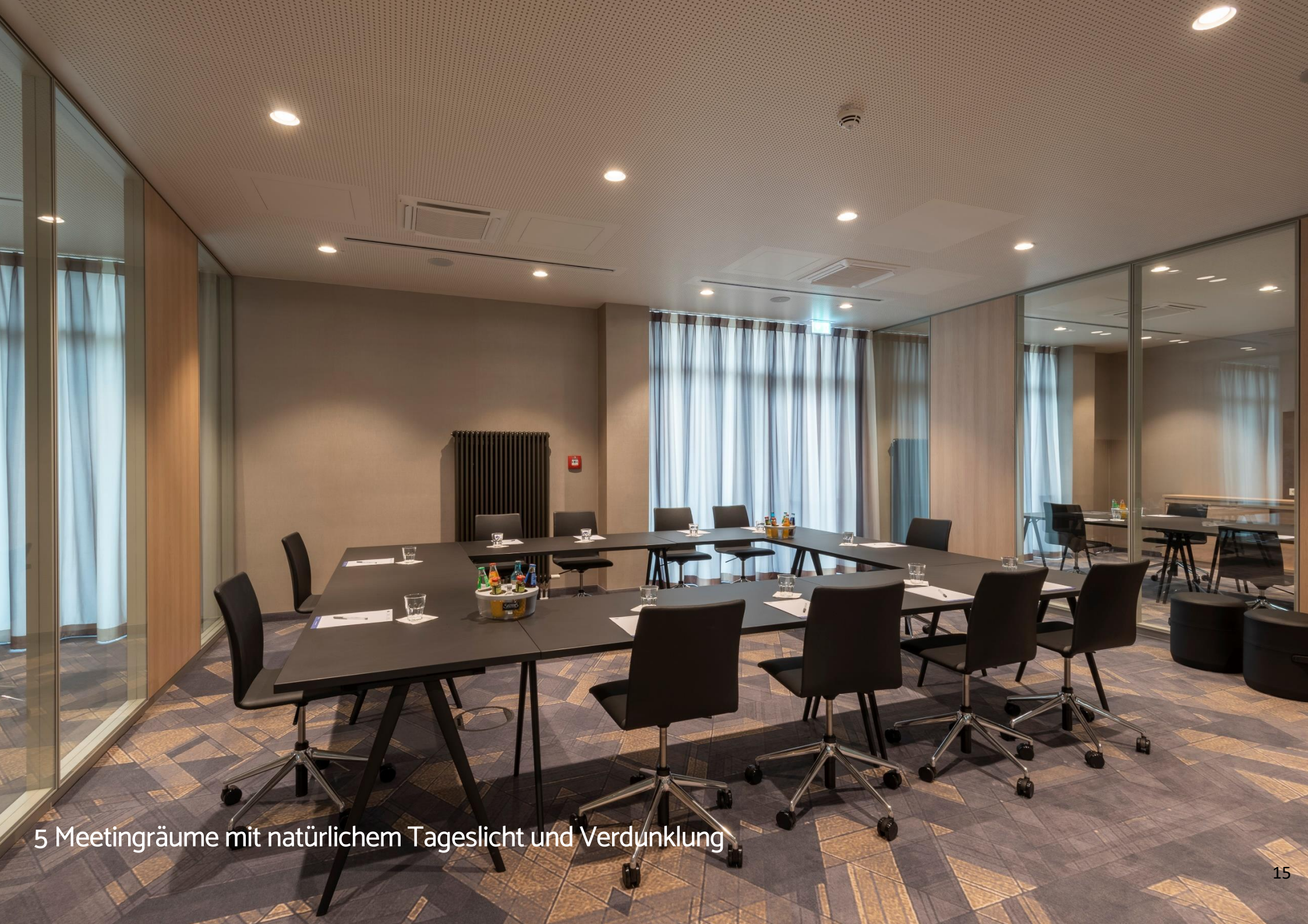
5 Meetingräume mit natürlichem Tageslicht und Verdunklung