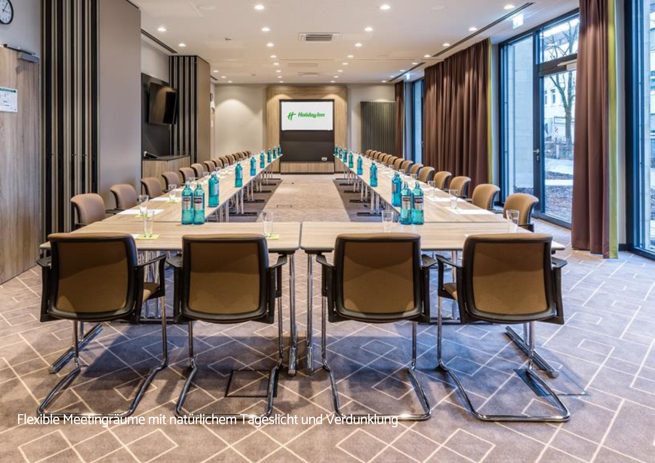
Flexible Meetingräume mit natürlichem Tageslicht und Verdunklung