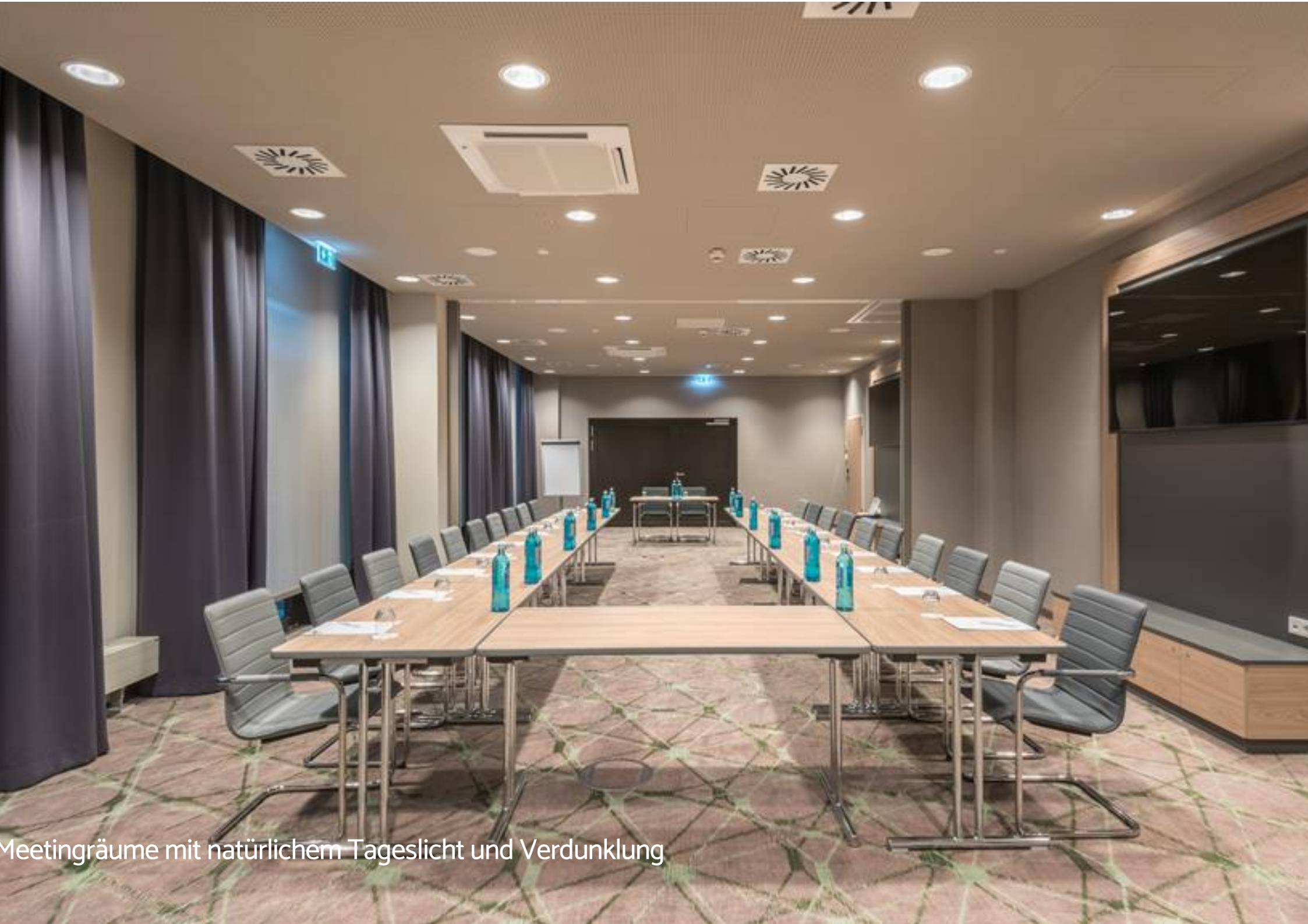
Meetingräume mit natürlichem Tageslicht und Verdunklung