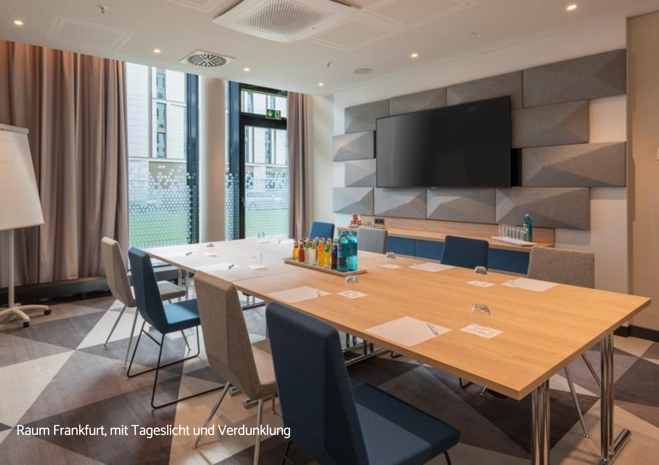
Raum Frankfurt, mit Tageslicht und Verdunklung